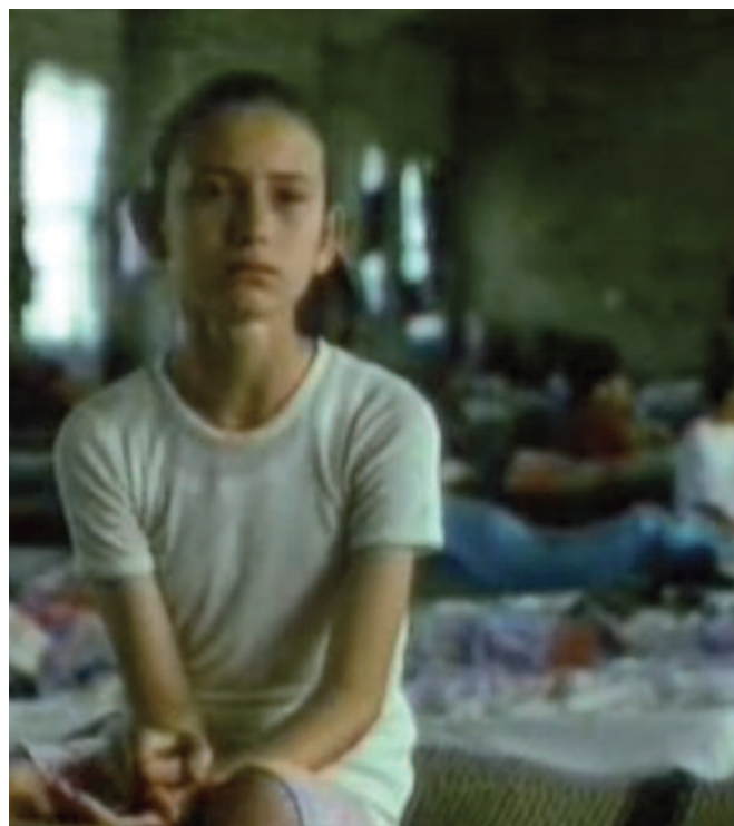
Fotogramas del vídeo El olvido de la memoria , de Iñaki Elizalde, una película que nos hace pensar sobre si aprendemos de los errores.