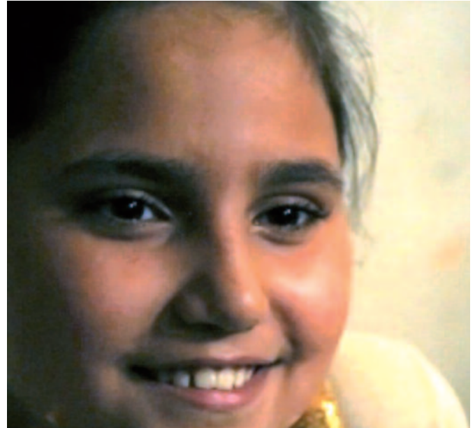
Imanol Arias y Aya, en dos fotogramas del vídeo Imanol Arias presta su voz a Aya .