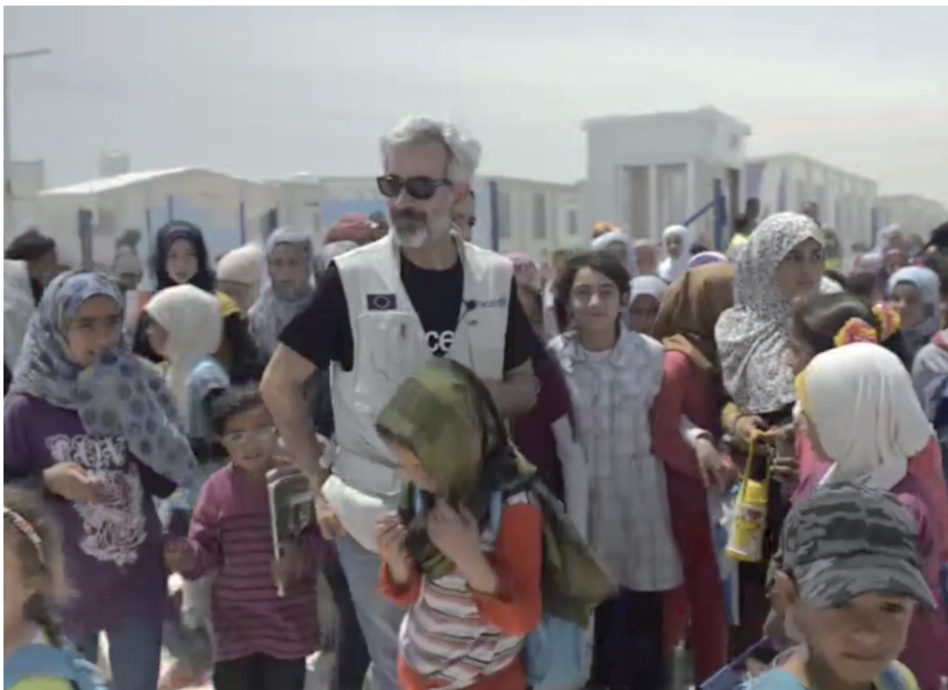
Imanol Arias en un campo de refugiados de Siria en Jordania en una imagen perteneciente al vídeo El viaje de Imanol .